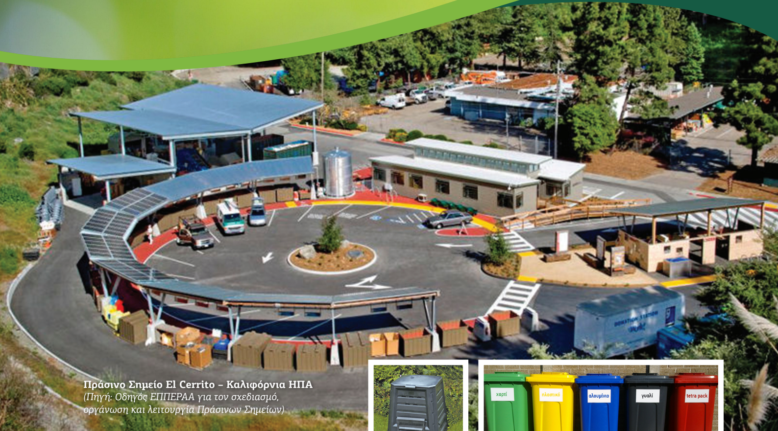
Πράσινο Σημείο El Cerrito – Καλιφόρνια ΗΠΑ